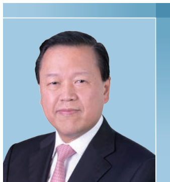
雷添良 SBS, JP 主席